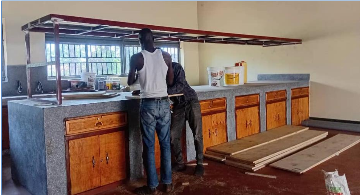
Die Inneneinrichtung für die Hauswirtschaft entsteht

Im seit 2025 angegliederten Lehrgarten bauen Schülerinnen und Schüler unter Anleitung zweier Agrarökonomen verschiedene Nutzpflanzen, wie z.B. Tomaten, Mais, Süßkartoffeln, aber auch Erdnüsse und Sesam an.