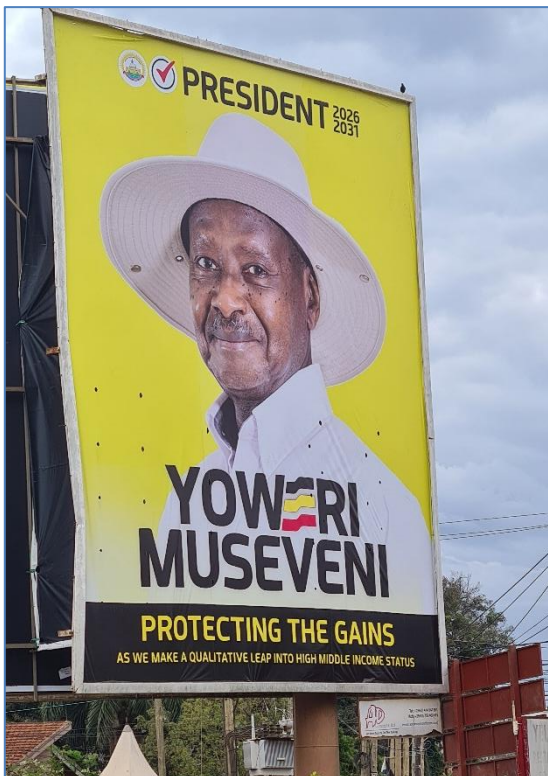
Wahlplakat des seit 1986 regierenden Präsidenten

In der Bilanz sind die Löhne und Gehälter der größte Kostenblock. Darauf folgen Ausgaben für Stipendien und Nahrungsmittel. Lehrkräfte verdienen – abhängig von Qualifikation und Dauer der Zugehörigkeit – zwischen 90 und 240 Euro im Monat, Reinigungskräfte rund 50 Euro, die beiden Internatsmütter je etwa 100 Euro, das Wachpersonal etwa 65 Euro. Männer und Frauen erhalten die gleiche Bezahlung. Alle Beschäftigten bekommen unentgeltlich Frühstück, Mittagessen und bei Spätdiensten auch ein Abendessen.