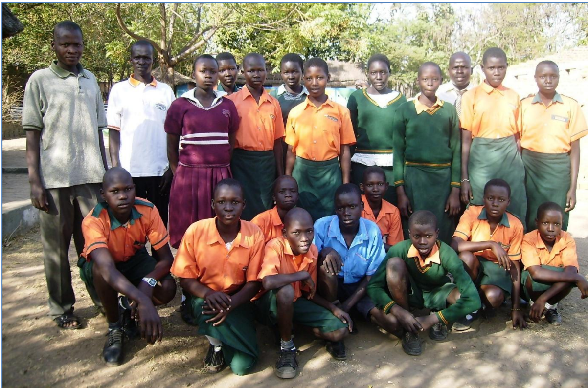
Die Pioniere. Der Abschlussjahrgang 2011. Damals nur 18 Jugendliche.

Die Schule entwickelte sich seit 2006 in mehreren Abschnitten: Im ersten Jahr lernten 35 Kinder in der Nursery School (Kindergarten/ Vorschule). Nach und nach entstanden die Klassen eins bis sieben der Primary School (Grundschule). Schließlich legten im November 2011 die ersten Siebtklässler ihre staatlichen Abschlussprüfungen (PLE) ab – ein wichtiger Meilenstein.