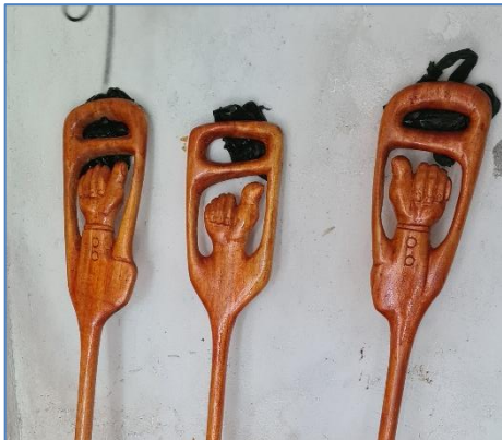
Arbeiten aus dem Schnitzkurs

Neben den Hauptfächern Integrated Science (Biologie, Chemie, Physik), Social Studies (Geschichte, Geografie, Religionsunterricht), Mathematik und Englisch stehen auch kreative Fächer auf dem Stundenplan: traditioneller Tanz, Theater, Musik – sowohl traditionell als auch modern – aber auch Handarbeit wie Nähen oder Stricken. Neu war im Berichtsjahr