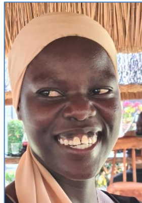
ist heute Hotelfachfrau

Ein guter Schulabschluss öffnet wiederum den Weg zu weiterer Bildung. Mit einem eigenen Stipendienprogramm unterstützt UgandaKids bereits seit 2014 besonders motivierte und bedürftige Jugendliche mit sehr guten Prüfungsergebnissen bis zum Abschluss einer weiterführenden Schule oder einer Berufsausbildung. Viele ehemalige Stipendiatinnen und Stipendiaten haben heute qualifizierte Berufe;