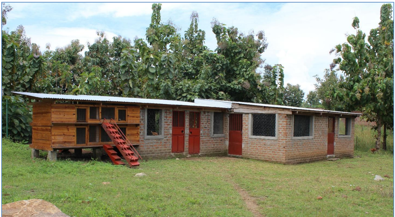
Die Ställe für die Nutztiere des landwirtschaftlichen Zweiges der Lehrwerkstätten

Im vergangenen Jahr haben die Lehrwerkstätten mit der Vermittlung landwirtschaftlicher Kenntnisse begonnen. Ein neu gebauter Schweinestall ermöglichte die Schweinezucht, in diesem Jahr folgten Hühner, Kaninchen und Ziegen.